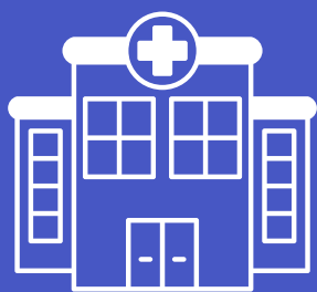
FILIALES DE CRUZ ROJA CHILENA

A través de la red de filiales se organiza la entrega de recursos.