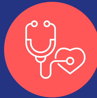
ATENCIONES DE SALUD PRIMARIA

Se le otorga salud primaria a las familias afectadas.